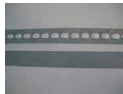
Open en dichte anti-dust tape